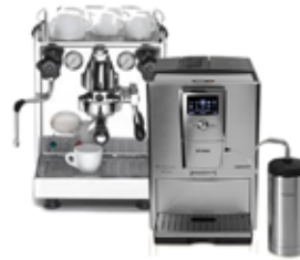
Espressomaschinen und Kaffeevollautomaten