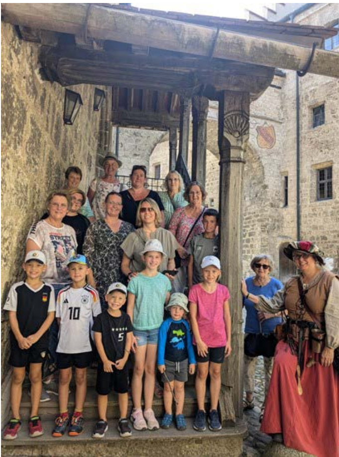
Eine Reise in die Vergangenheit bot die Burg Burghausen.

An einem schönen Sommertag unternahm die kfd Zangberg einen Ausflug nach Burghausen. Zusammen mit einigen Kindern ging es auf die weltlängste Burg. Dort angekommen wurden wir schon von einer Dame aus dem Mittelalter empfangen. In ihrer authentischen Kleidung führte sie uns vom Anfang der Burg bis zur Hauptburg. So haben wir gleich zu Beginn viel über die Geschichte und Entstehung der Burg erfahren. Zudem durften die Kinder das ein oder andere Spiel selbst ausprobieren. Neben den Erzählungen und Aktivitäten konnten wir den schönen Blick auf die Altstadt auf der einen Seite bzw. den Wöhrsee auf der anderen Seite der Burg genießen. Zum Schluss gab es im Burgcafé für die Kinder ein Eis und für die Erwachsenen Kaffee und Kuchen, bevor wir anschließend die Heimreise antraten.