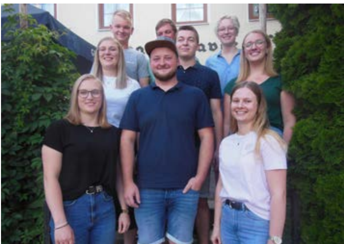
Die neu gewählte Vorstandschaft der Landjugend. (Bericht und Foto: Anneliese Angermeier)

Was steht an bei der Landjugend? Für den 2. Oktober ist das Weinfest an der Stockschützenhalle geplant, ebenfalls im Oktober wird in Steng ein Ackercross Rennen mit After Racing Party stattfinden, die Landjugend wird den Barbetrieb übernehmen. Mit einem Dank an die bisherige Vorstandschaft, verbunden mit dem Dank für die tatkräftige Unterstützung durch alle Landjugendmitglieder und den besten Wünschen für die neu gewählte Vorstandschaft endete die Versammlung mit einem gemeinsamen Abendessen.