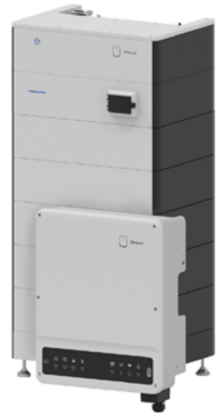
Stromspeicher und Solarsysteme