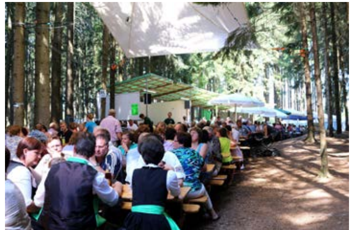
Ein herrliches Ambiente bot der Wald zwischen Aspertscham und Schönberg.

Ein Bombenerfolg war wieder das Waldfest der Johannesschützen, gemeinsam mit der Feuerwehr Aspertscham. Auch nach 30 Jahren erfreut sich die Veranstaltung im Wald bei Groß und Klein, Alt und Jung großer Beliebtheit. Dazu beigetragen hat auch das Bilderbuchwetter. Los ging es bereits mit einem fulminanten Start am Samstag mit der Walddisco. Traditionell begannen die Feierlichkeiten mit dem Festgottesdienst für die verstorbenen Mitglieder, die vom Kirchenchor gesungene „Waidler-Messe“ verhallte im Wald. Kulinarisch wurden die Gäste bestens versorgt, für die musikalische Unterhaltung sorgten „Hans und Martli“. Als am Abend die Dunkelheit über die Waldlichtung herein brach, tauchten eine Vielzahl von bunt brennenden Lichtern und Lampen den idyllischen Festplatz in ein buntes Lichtermeer.