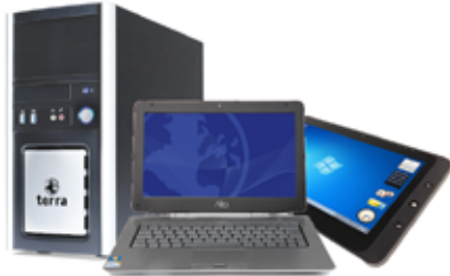
Computer, Software und Zubehör für Gewerbe und Privat