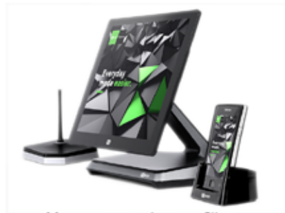
Kassensysteme für Gastronomie und Handel

Informations- und Kommunikationstechnik Kassensysteme Kaffeetechnik Stromspeicher und Solarsysteme Technik und Vertrieb