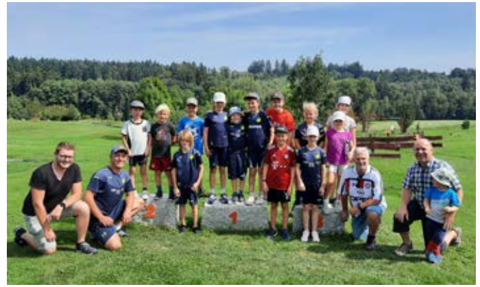
Jede Menge Spaß hatten alle Teilnehmer beim Fußballgolf.

meinsamen Mittagessen stärkten, wurde noch ausgiebig weitergebolzt.