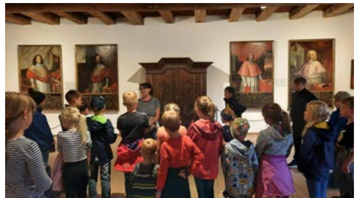
In den historischen Räumen erfuhren die Mädchen und Jungen vieles über das Mittelalter.

An einem verregneten, kühlen Ferientag machten sich 22 Kinder mit ihren fünf Betreuerinnen auf zur Burg Tittmoning. Der Verein für Gartenbau und Landespflege Zangberg lud die Kinder im Rahmen des Ferienprogramms ein, die im Jahr 1234 erbaute Grenzbürg in einer eigenen Kinderführung zu erkunden. Schon im großen Burgtor wurden wir von der Burkatze Bärli empfangen. Staunend begutachteten die Kinder den Türkenofen, das Mittelalter-Klo, Waffen, Kienspanhalter und Co. In der mittelalterlichen, gut ausgestatteten Küche erfuhren wir, wieviele Sprichwörter aus dieser Zeit stammen. Im Wehrgang bei windigem, regnerischem Wetter durch die Pechnase in die Tiefe zu schauen war einfach beeindruckend! Nach der kurzweiligen Führung durften alle noch kreativ werden und eine eigene Stofffahne mit Wappen gestalten.